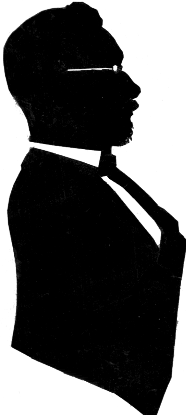
Abbildung 2: Zeitgenössischer Scherenschnitt von Max Uhle