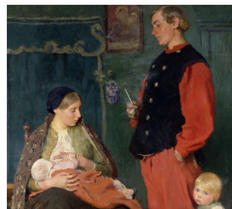
Alte Nationalgalerie: Gari Melchers – Die Familie (Ausschnitt / Detail)

In Zusammenarbeit mit / In cooperation with Freunde* Guter Musik Berlin e. V.