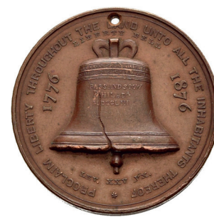
Münzkabinett: William H. Key: Medaille zum 100. Jahrestag der amerikanischen Unabhängigkeitserklärung / Medal commemorating the 100 th anniversary of the Declaration of Independence, 1876

Führung / Guided Tour 250 Years of the USA – American Positions (English) 4.7.2026 13:00