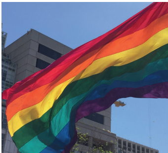
Neue Nationalgalerie: Gilbert Baker – Rainbow Flag, 1978

Two neon signs spell out the word »America.« One glows white, the other is partly painted over in black, giving it a ghostly aura. Glenn Ligon (*1960) is one of the most significant conceptual artists of our time. Through efficient use of language and text, his work examines fundamental ideas of the American narrative. For whom does the idea of America serve as a beacon of hope — and for whom does it not?