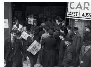
Museum Europäischer Kulturen: Ausgabe von Lebensmitteln aus amerikanischen CARE-Paketen an streikende Reichsbahner / Distribution of food from American care packages to striking Reichsbahn workers

General Friedrich Wilhelm von Steuben, der 1777 an Bord der Fregatte Flamand das revolutionäre Amerika erreichte. Das ausgestellte Schiffsmodell erinnert an die turbulente Überfahrt sowie an Steubens Beitrag zur Neuordnung der amerikanischen Armee.