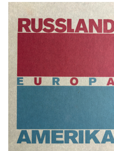
Kunstabibliothek: Erich Mendelsohn – Russland, Europa, Amerika

Fortsetzung auf der anderen Seite / Continued on the other side