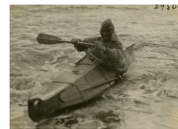
Ethnologisches Museum: Inuit beim Kajakfahren (bekleidet mit einem Parka aus Darm) / Inuit in a kayak (wearing a gut-skin parka made of seal intestines), Foto 5. Thule- Expedition, 1921–24

Im Geheimen Staatsarchiv Preußischer Kulturbesitz lassen sich Spuren prägender Akteure der amerikanischen Unabhängigkeitsbewegung entdecken. Hervor sticht der preußische Offizier und spätere amerikanische