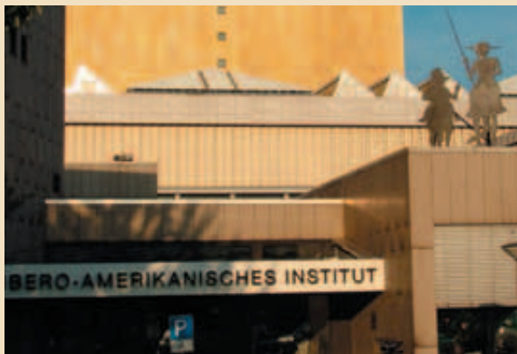
Potsdamer Straße 37: sede actual del IAI