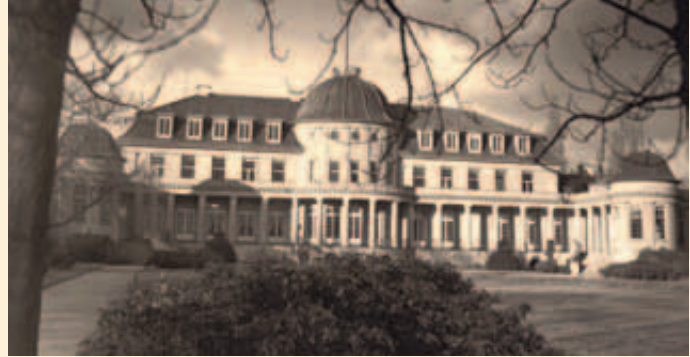
La Villa Siemens en Lankwitz: segunda sede del IAI

El trabajo científico del Instituto se desarrollaba entonces con limitada autonomía respecto de la política general de Faupel. Ya en 1930, el IAI había asumido como parte de su programa la publicación de la revista interdisciplinaria Ibero-Amerikanisches Archiv , fundada por Otto Quelle. A partir de 1939 apareció Ensayos y Estudios , una revista de cultura y filosofía en lengua española y portu-