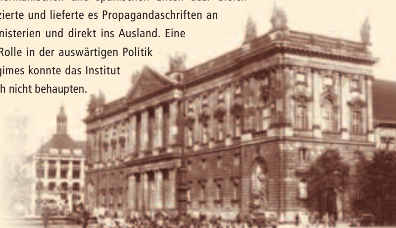
Marstall: Erster Sitz des IAI

Faupel bezog wichtige Positionen in verschiedenen zwischenstaatlichen Wirtschafts- und Interessenverbänden und schuf ein dichtes Netzwerk von Beziehungen mit der ibero-amerikanischen Welt. Unter seiner Führung baute das IAI seine Rolle als Anlaufstelle für Vertreter der lateinamerikanischen und spanischen Eliten aus. Gleichzeitig produzierte und lieferte es Propagandaschriften an deutsche Ministerien und direkt ins Ausland. Eine prominente Rolle in der auswärtigen Politik des Nazi-Regimes konnte das Institut für sich jedoch nicht behaupten.