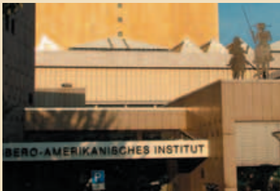
Potsdamer Straße 37: Heutiger Sitz des IAI