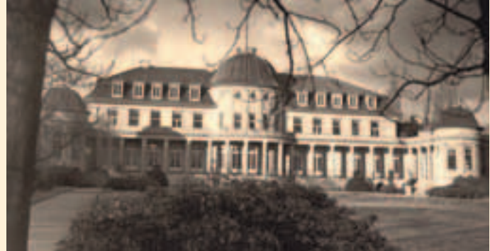
Ehemalige Siemens-Villa in Lankwitz: zweiter Sitz des IAI

Mit beschränkter Autonomie gegenüber Faupels allgemeiner Institutspolitik entfaltete sich zu jener Zeit die wissenschaftliche Arbeit. Das IAI hatte bereits 1930 die Publikation der von Otto Quelle gegrün-