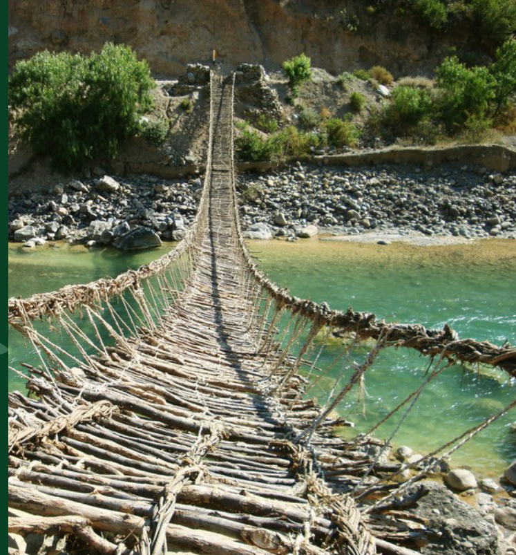
Puente Tinkuqchaka INDIANA 38.2 (2021)

Suscripciones y ventas / subscriptions and sale: Gebr. Mann Verlag Berlin www.reimer-mann-verlag.de/mann