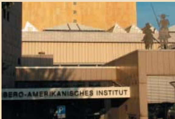
Potsdamer Straße 37: sede actual do IAI