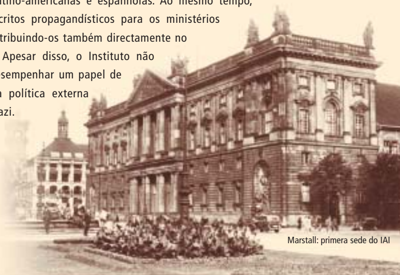
Marstall: primera sede do IAI

Faupel ocupou cargos importantes em diversas organizações económicas e outras associações, e criou uma estreita rede de relações com a América Latina e a Península Ibérica. Sob a sua direcção, o IAI reforçou o seu papel como centro de referência para os representantes das elites latino-americanas e espanholas. Ao mesmo tempo, produziu escritos propagandísticos para os ministérios alemães, distribuindo-os também directamente no estrangeiro. Apesar disso, o Instituto não chegou a desempenhar um papel de destaque na política externa do regime nazi.