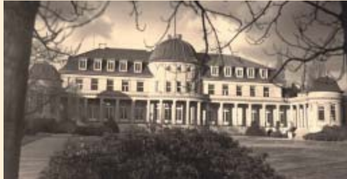
A Villa Siemens em Lankwitz: segunda sede do IAI

O trabalho científico do Instituto era, nessa altura, desenvolvido com autonomia limitada em relação à política geral de Faupel. Já em 1930 o IAI tinha assumido como parte do seu programa a publicação