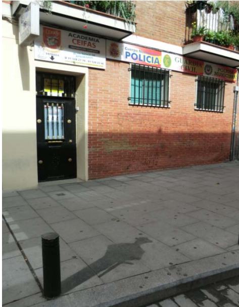
Abb. 1: Schatten eines Straßenpfostens in der Straße Doctor Foquet in Lavapiés