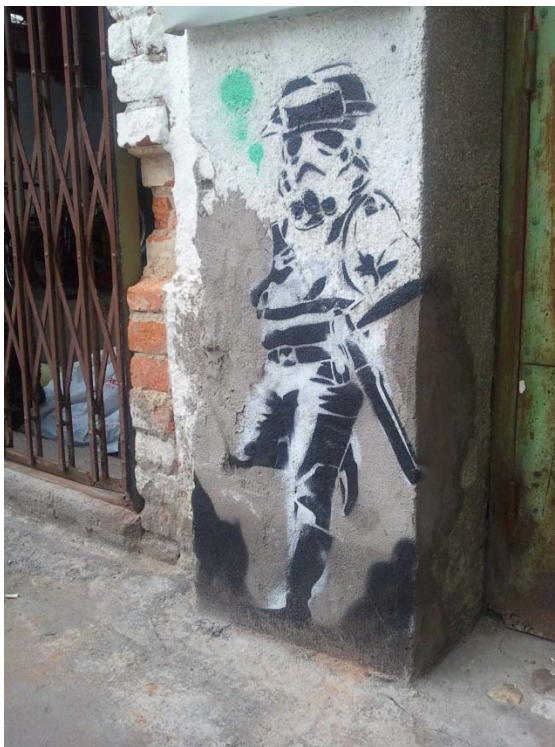
Abb. 3: Schablonenmalerei in der Straße Sombrete