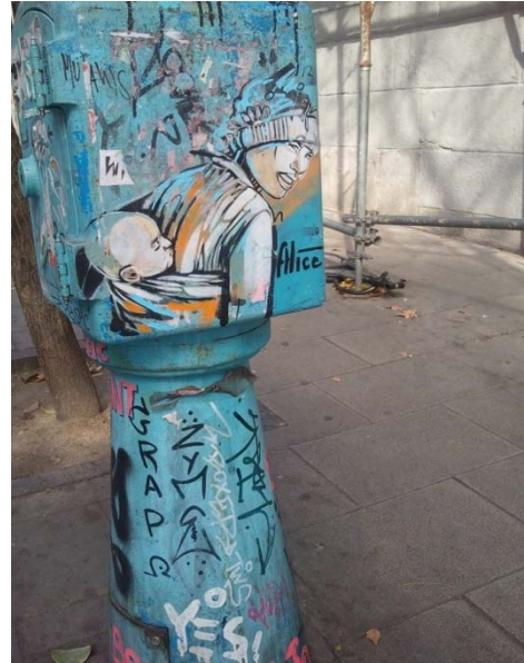
Abb. 2: Bild einer afrikanischen Frau integriert in einem Elektrizitätskasten auf der Straße Embajadores in Lavapiés (Alice)