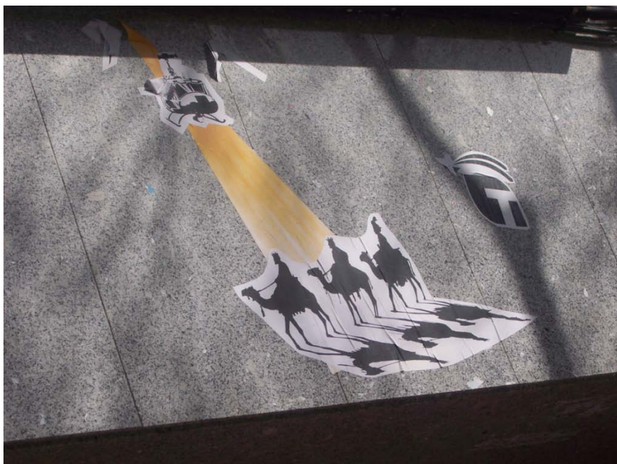
Abb. 4: Schablonenaufkleber in der Straße Argumosa