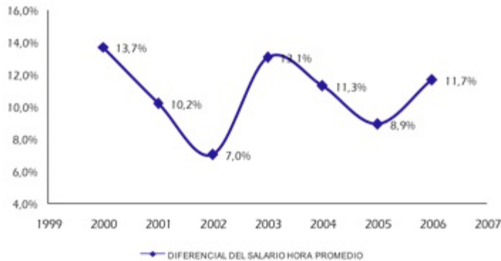
Abbildung 9: "Unterschiede im durchschnittlichen Stundenlohn zwischen Männern und Frauen", Bernat Díaz 2009: 29).

Die größten Unterschiede im Einkommen fanden sich bei den geringer gebildeten Personen, die Teilzeitarbeit nachgingen, im Haushalt und in kleinen Unternehmen angestellt waren (Hoyos et al. 2010: 27 f.). In Bezug auf das Wohlbefinden ist festzustellen, dass Frauen mit einem niedrigen Bildungsabschluss am ehesten unter Diskriminierung leiden, obwohl aus ökonomischer Perspektive Frauen mit einem Universitätsabschluss proportional deutlich stärker von Einkommensdiskriminierung betroffen sind (Bernat-Díaz 2009: 208).